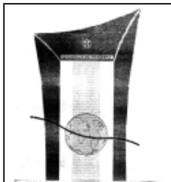
Aspecto de la futura rotonda.